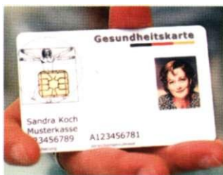
Die elektronische Gesundheitskarte