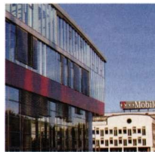
Unternehmenszentrale T-Mobile in Bonn